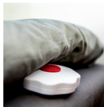
Varseblivningshjälpmedel - vibrerande larmdon